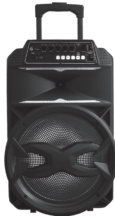
Parlante Activo 15" PK-27BAT

⚠ Please carefully read the operating instruction before using our product